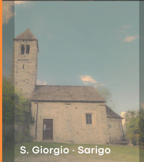
S. Giorgio · Sarigo

This entry was posted on Wednesday, June 10th, 2026 at 5:55 pm and is filed under Tempo libero . You can follow any responses to this entry through the Comments (RSS) feed. You can skip to the end and leave a response. Pinging is currently not allowed.