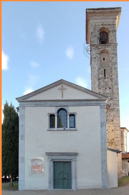
S. Giovanni · Germignaga

ore 20.30 presentazione restauro dell'affresco