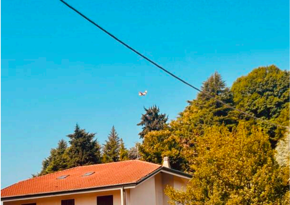
Canadair 16 decollato da Malpensa, fotografato sopra Gallarate

Nella tarda mattina di venerdì 10 luglio tra Ossola e Valsesia erano operativi i Canadair 11, 16, 21 e 30, decollati da Genova, Roma e anche Milano Malpensa, dove alcuni hanno fatto scalo tecnico nella notte.