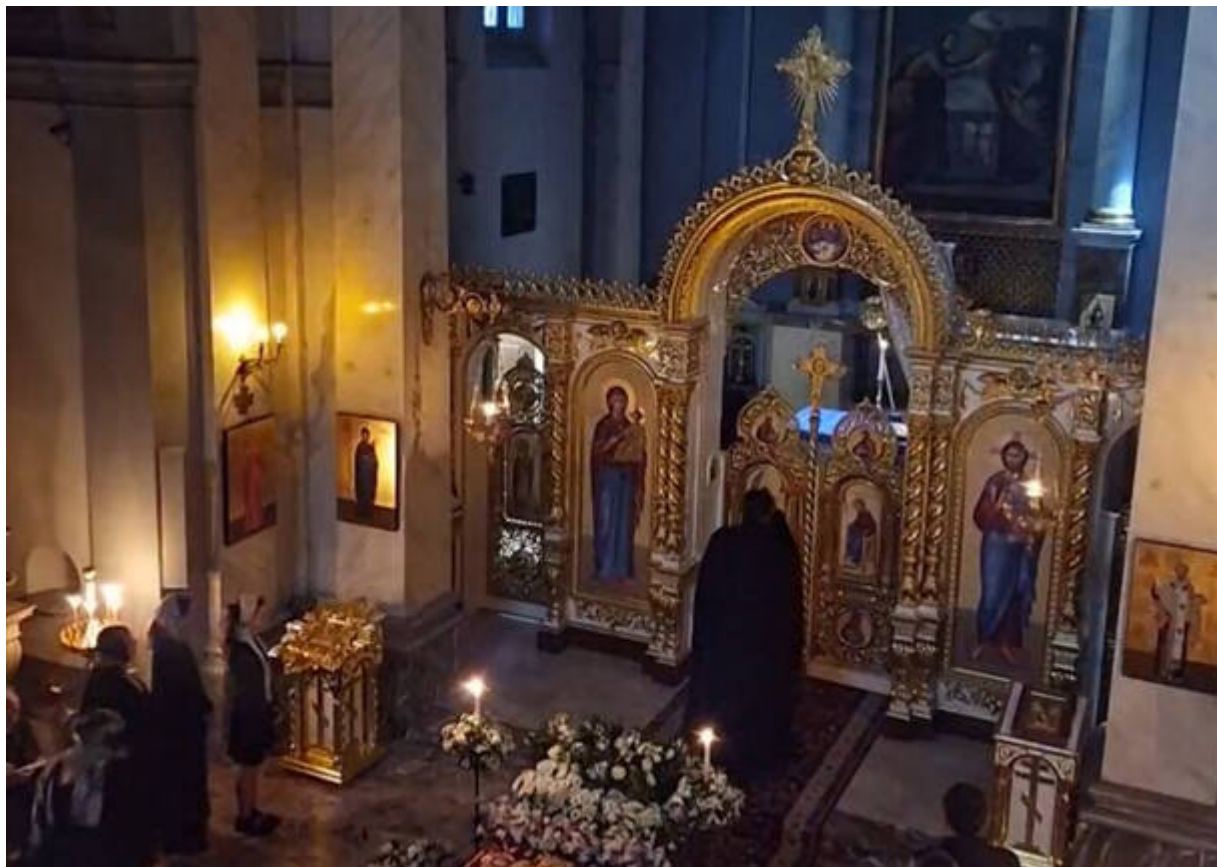
Celebrazione della settimana Santa al monastero di Cristo Pantocratore ad Arona